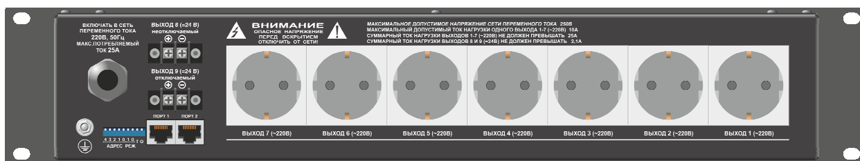
Рисунок 6.2. Задняя стенка РП.

На задней панели расположены клемма защитного заземления, переключатели задания адреса и режимов работы, розетки интерфейса связи, клеммники низковольтного питания, розетки для подключения нагрузки, питающейся от сетевого напряжения (рисунок 6.2).